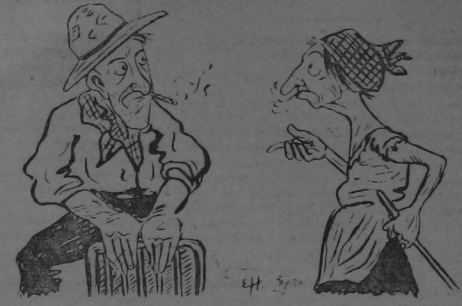
—¡Jura de chanza, Na Lisar! ¿qué opina usted de lo de don Diego y la renuncia? —Que qué opino yo? Que vale más ser olote ó ser chanchó y estar amarrado a una escobilla, que ser Gobernador.